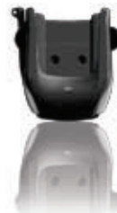
Culla veicolare alimentata