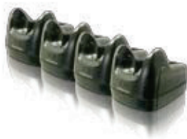
Culla a 4 posizioni con carica batteria supplementare (connessione Ethernet opzionale)