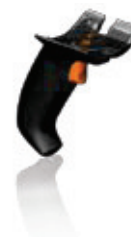
Manico ad innesto rapido

Per ulteriori informazioni e dettagli sull'utilizzo vi invitiamo a consultare il manuale utente all'indirizzo www.mobile.datalogic.com/manuals