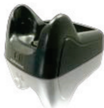
Culla singola con carica batteria supplementare (connessione Ethernet o Modem opzionale)