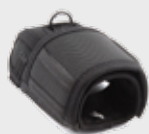
▪ 11-0109 PowerHood