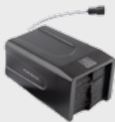
▪ 11-0138 Supporto riscaldato, 36 V ▪ 11-0139 Supporto riscaldato, 24 V ▪ 11-0140 Supporto riscaldato, 48 V