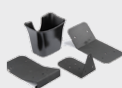
▪ 11-0111 Kit di montaggio universale